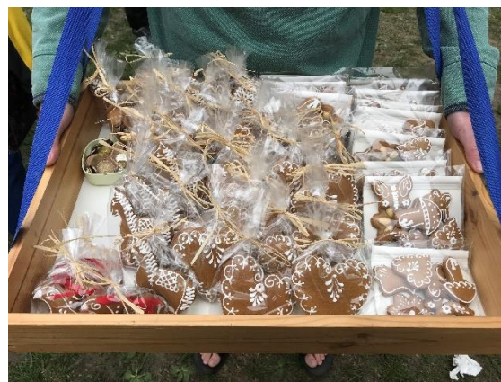
Domácí perníčky pro děti i babičky

Mnozí Skuhrovští i Huntířovští každoročně vyrážejí na pouť na Krásné v Kittelově areálu, kde se scházejí prodejci, řemeslníci i umělci ze široka daleka, aby se s ostatními podělili o svůj um ať již při vystoupení (pravidelně zde zpívá náš smíšený pěvecký sbor T. J. Sokol Huntířov) či prodejem svého zboží. Zvláštní oblibě se vždy těší také stánky s občerstvením.